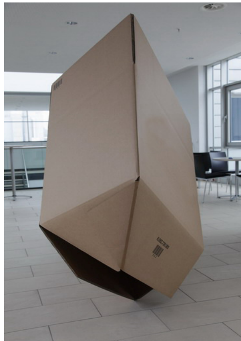
( Technikbeispiel Bodenkonstruktion )