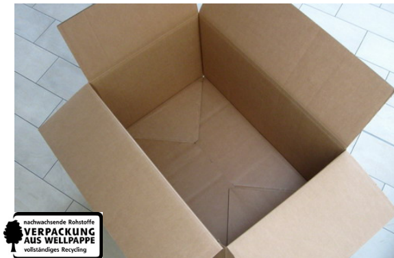
( Innenansicht )