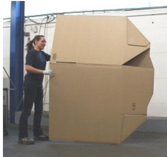
Fefco 0201 - Autoboden