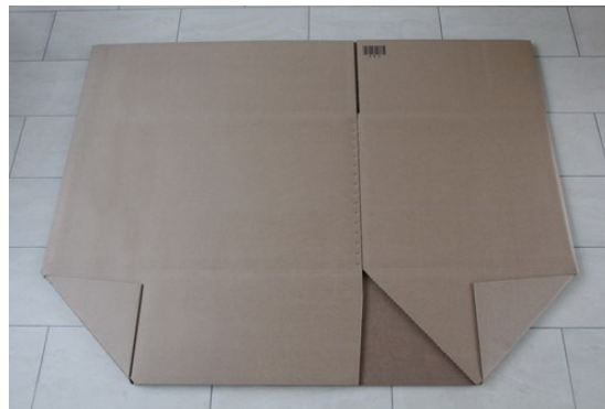
( flachliegende Anlieferung )